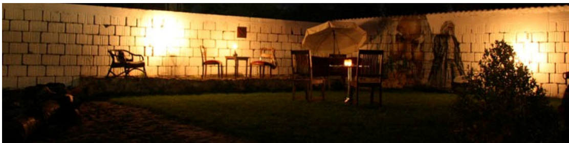
Im „Haus-Park“ gibt's zwar schon gemütliche Ecken, aber auch noch viel zu tun...