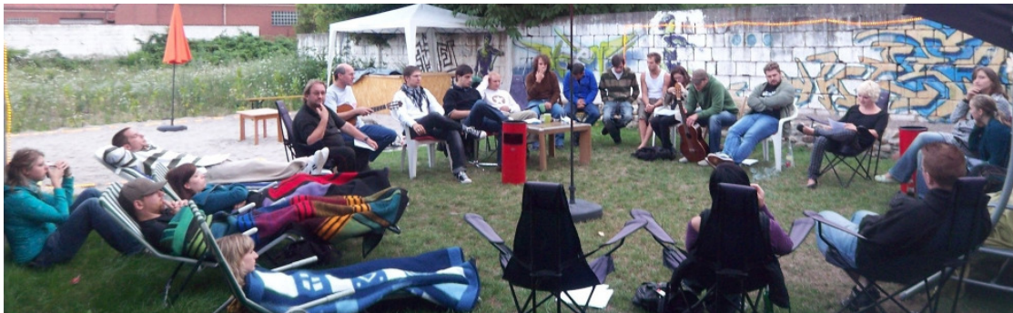
Im Hauskreis treffen sich 20-30 junge Menschen