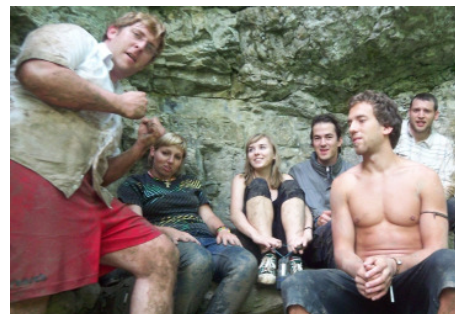
Gemeinschaft im Grünen und Abenteuer bei der Höhlentour bietet der „RAUSKREIS“

Wir bemühen uns, gerade jungen Leuten ein Forum zu bieten, innerhalb dessen sie eigene Ideen umsetzen und ihre Talente einsetzen können, und helfen dadurch, das Landauer Stadtleben ein wenig bunter zu gestalten.